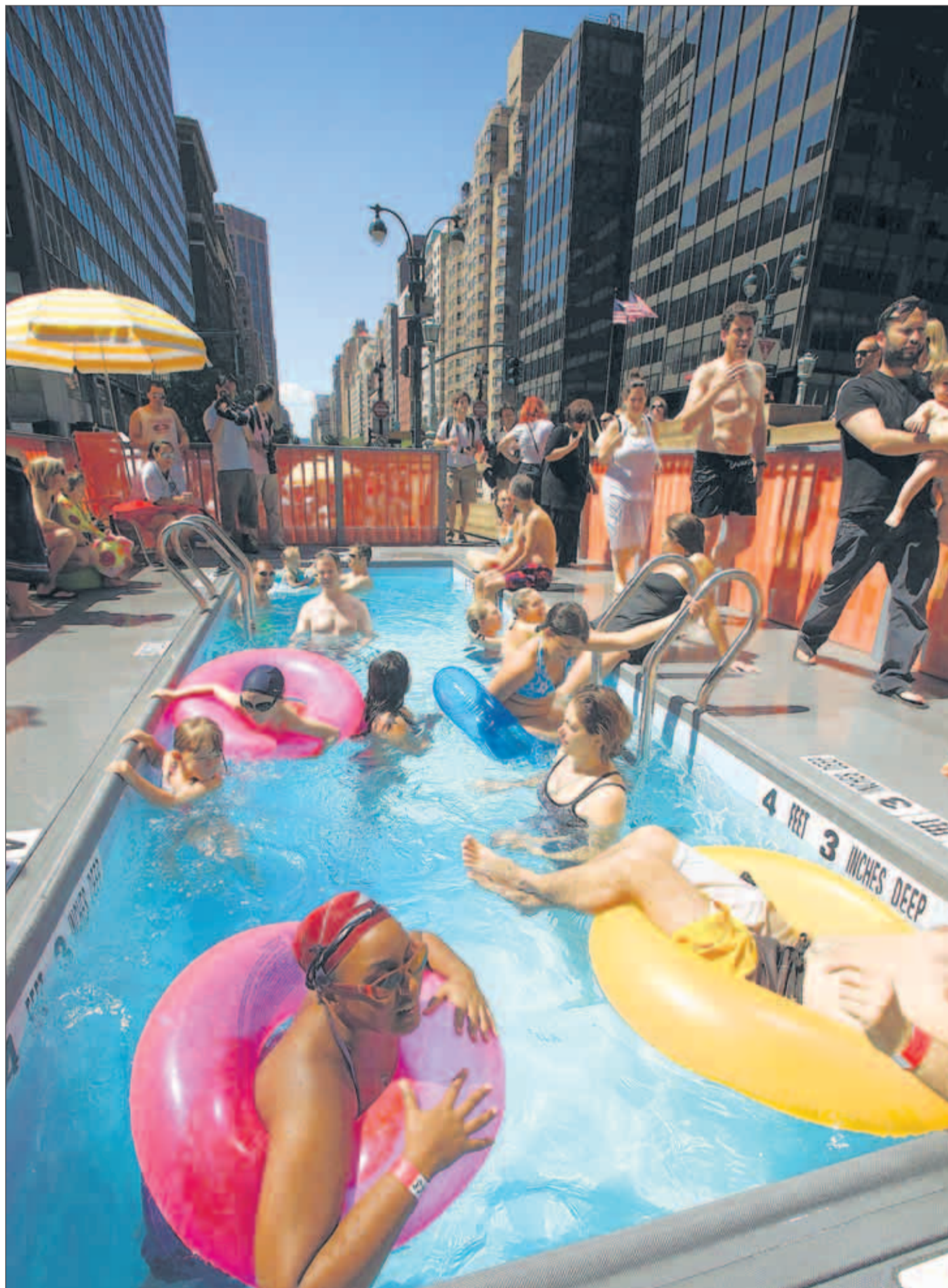
Kreatives New York: Seit drei Jahren wird die Park Avenue an den Samstagen im August zur Fußgängerzone – und für manche zum Swimmingpool

Florida: Ich habe natürlich keine Kristallkugel. Ich rechne aber damit, dass unsere Städte in 20 Jahren größer und dichter besiedelt sein werden und dass die Grenze zwischen Arbeit und Freizeit immer mehr Menschen von zu Hause arbeiten. Rückblickend werden wir uns dann vermutlich darüber wundern, dass wir uns einst freiwillig