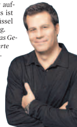
Buchautor Richard Florida schätzt das kreative Potenzial Berlins hoch ein